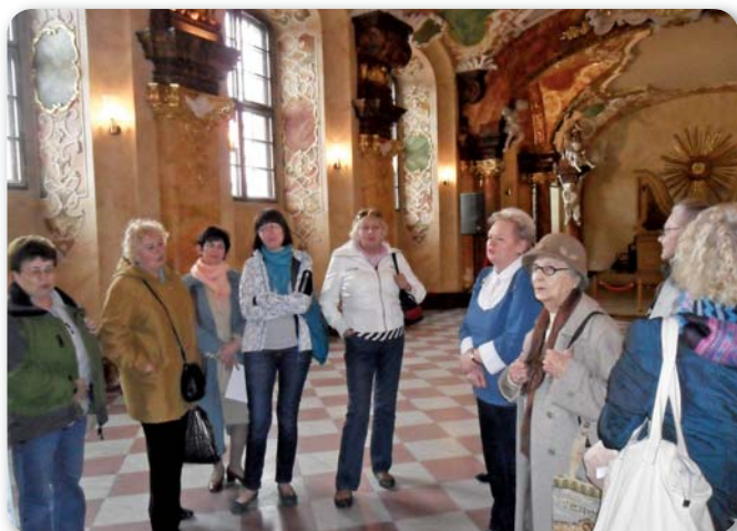
Wspólny śpiew w Oratorium Marianum

na Miodka, znanego polskiego językoznawcę. Przytoczyła też anegdotę związaną z jego działalnością dydaktyczną. Wdzięczni studenci-obcokrajowcy, w podziękowaniu za lektorat języka polskiego, na ostatnich zajęciach wręczyli Profesorowi wiązankę kwiatów. Bukiet zdobiła szarfa „Ostatnie Pożegnanie”. Profesor, znany z poczucia humoru, z uśmiechem wyjaśnił zaistniałe qui pro quo .