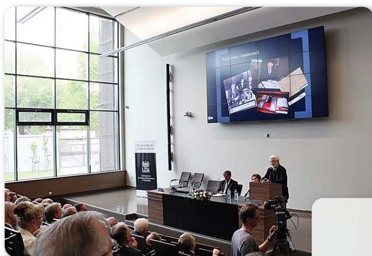
Otwarcie Auli Zygmunta Ziemińskiego