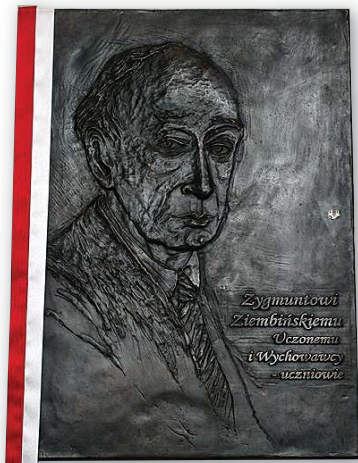
Tablica Zygmunta Ziemińskiego w Collegium Iuridicum Novum