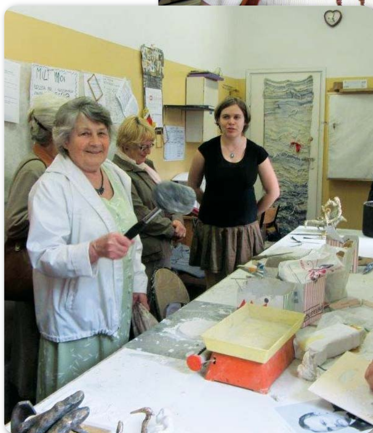
FOT. 3X - H. KACZMAREK