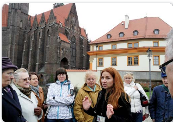
Spacer po Wrocławiu